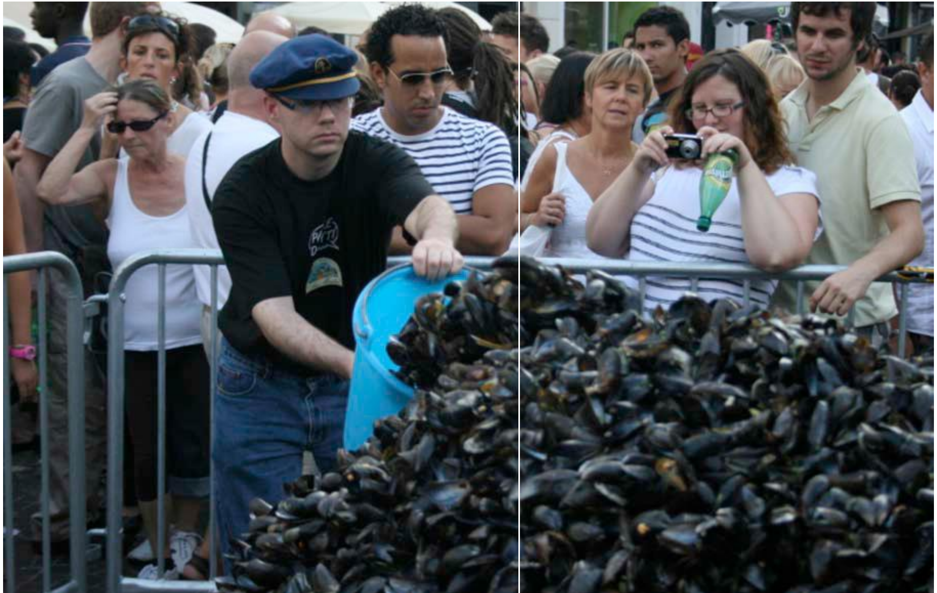
Aus: Böing 2014: 20